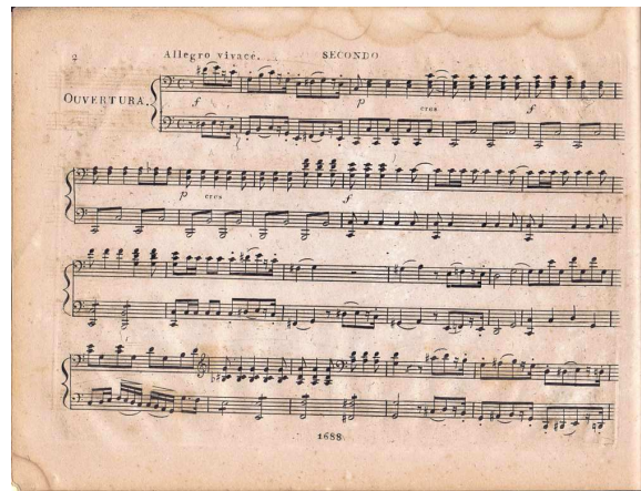
楽譜の冒頭頁(序曲の四手連弾編曲の左頁。p.2)