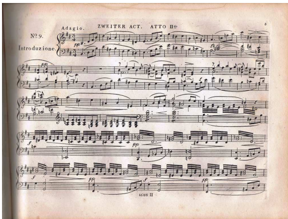
第 2 幕冒頭頁(p.3)